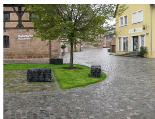
Gegenüber befindet sich der Eingang