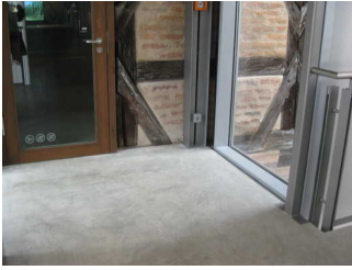
Ticketscanner im Vorflur der Ausstellung