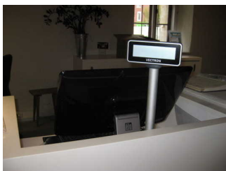
Kasse mit Display