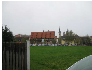
Sicht zum Museum von der Haltestelle aus